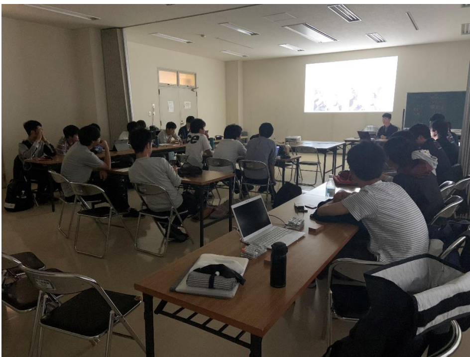
写真3, 写真4 デザインレビューでの様子